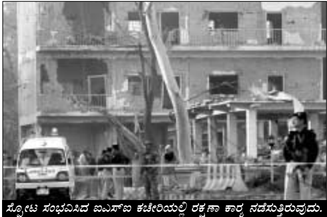
ಸೋಮ್‌ನ ಸಂಭವಿಸಿದ ಐಎಸ್‌ಐ ಕಚೇರಿಯಲ್ಲಿ ರಕ್ಷಣಾ ಕಾರ್ಯ ನಡೆಸುತ್ತಿರುವುದು.

ಇಸ್ಲಾಮಾಬಾದ್: ಪಲವು ವರ್ಷಗಳಿಂದ ಭಯೋತ್ಪಾದಕರಿಗೆ ಬೆಂಬಲ ನೀಡುತ್ತಲೇ ಬಂದಿರುವ ಪಾಕಿಸ್ತಾನದ ಗುಪ್ತಚರ ಸಂಸ್ಥೆ ಐಎಸ್‌ಐನ ಕಚೇರಿಯ ಮೇಲೆ ಈಗ ಉಗ್ರರು ಬಾಂಬ್ ದಾಳಿ ನಡೆಸಿದ್ದಾರೆ. ಪೇಶಾವರದಲ್ಲಿರುವ ಐಎಸ್‌ಐ ಕೇಂದ್ರ ಕಚೇರಿ ಮೇಲೆ ಮತ್ತು ಬೆಲೈಯ ಪೊಲೀಸ್ ಠಾಣೆಯೊಂದರ ಮೇಲೆ ಉಗ್ರರು ಶುಕ್ರವಾರ ಆತ್ಮಹುತಿ ದಾಳಿ ನಡೆಸಿದ್ದು, 20 ಮಂದಿ ಬಲಿಯಾಗಿದ್ದಾರೆ. ■ ಬೆಂಬಲಿಸಿದವರಿಗೇ ಬಾಂಬ್: ಶುಕ್ರವಾರ ಮುಜಾನ್ 6.40ರ ಸುಮಾರಿಗೆ ಆತ್ಮಹುತಿ ದಾಳಿಕೋರನೊಬ್ಬ 200 ಕೆ.ಜಿ. ಸ್ಫೋಟಕಗಳನ್ನು ತುಂಬಿದ್ದ ಕಾರನ್ನು ಐಎಸ್‌ಐ ಕಚೇರಿಯೊಳಗೆ ನುಗ್ಗಿಸಿ ಸ್ಫೋಟಿಸಿದ. ಪರಿಣಾಮ 7 ಐಎಸ್‌ಐ ಸಿಬ್ಬಂದಿ ಸೇರಿ 12 ಮಂದಿ ಸಾವನ್ನಪ್ಪಿದ್ದು, 60ಕ್ಕೂ ಹೆಚ್ಚು ಮಂದಿ ಗಾಯಗೊಂಡಿದ್ದಾರೆ. ಘಟನೆ ನಿಯಂದಾಗಿ, ಉಗ್ರರನ್ನು ಪೋಷಿಸಿ ಬೆಳೆಸಿದ್ದ ಐಎಸ್‌ಐಗೆ ಮೈ ಪರಚಿಕೊಳ್ಳುವಂತಾ ಗಿದೆ. ಈ ಘಟನೆ ನಡೆದ 1 ಗಂಟೆ ಬಳಿಕ ಬನ್ನಿ ಬೆಲೈಯ ಬಕಾವೀಲ್ ಪೊಲೀಸ್ ಠಾಣೆಯ ಮೇಲೂ ಆತ್ಮಹುತಿ ದಾಳಿ ನಡೆಸಿದ್ದು, 8 ಮಂದಿ ಬಲಿಯಾಗಿದ್ದಾರೆ. 25ಕ್ಕೂ ಅಧಿಕ ಮಂದಿಗೆ ಗಾಯಗೊಂಡು, ಅದಾಗ್ಯೂ ಈ ದಾಳಿಗಳ ಹೊಣೆಯನ್ನು ಯಾವುದೇ ಉಗ್ರ ಸಂಘಟನೆ ಹೊತ್ತುಕೊಂಡಿಲ್ಲ. ಈ ಮಧ್ಯೆ, ಸೋಮ್‌ನ ಒಟ್ಟು ಆರೋಪಿಗಳನ್ನು ನಿಷೇಧಿಸಿ ಜಾರಿ ಮಾಡಲಾಗಿದೆ.