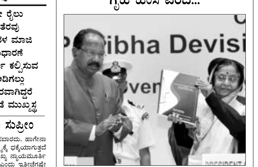
ನವದೆಹಲಿಯಲ್ಲಿ ಶುಕ್ರವಾರ ನಡೆದ 'ಮಹಿಳೆಯರ ರಕ್ಷಣೆಗಾಗಿ ಗೃಹ ಹಿಂಸೆ ನಿಯಂತ್ರಣ ಕಾಯ್ದೆಯ ಅನುಷ್ಠಾನದ ಬಗ್ಗೆನ ರಾಷ್ಟ್ರೀಯ ಸಮ್ಮೇಳನ'ದಲ್ಲಿ ರಾಷ್ಟ್ರಪತಿ ಪ್ರತಿಭಾ ಪಾಟೀಲ್ ಮತ್ತು ಕಾನೂನು ಸಚಿವ ಎಂ. ಎಲ್.ವೆಂಕಟೇಶ್ ಮೊಟ್ಟು ಅವರು ಗೃಹ ಹಿಂಸೆಯ ವರದಿಯನ್ನು ಬಹುಗಡೆ ಮಾಡಿದರು.